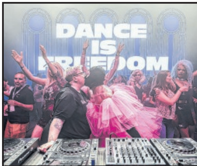
M.I.A., I Hate Models, The Blessed Madonna, quelques-uns des 50 artistes attendus avec Laurent Garnier, Amelie Lens, Central Cee, Damso.

Marsatac de jour, Marsatac de nuit. Pour sa 24 e édition, le festival de musiques actuelles marseillais s'alanguit au soleil et se prélassé dans la pelouse du Parc Borély, alors que les journées s'étirent. D'ordinaire très nocturne, avec des fins de soirée au petit matin, il opte cette fois-ci pour un format plus diurne, en s'épanouissant à l'air libre de 14h à 2h, les trois jours, à savoir les 10, 11 et 12 juin. L'une des raisons de ce changement est le site qu'il investit pour la deuxième fois, le Parc Borély, après une édition "Capsule" l'an dernier, un peu différente dans l'histoire du festival, plus resserrée, mais qui a donné des idées pour la suite. "Grâce à l'engagement de la Ville", comme le souligne Béatrice Desgranges, la directrice d'Orane, association qui porte le festival, Marsatac retrouve donc cet écran de verdure, mais son implantation, entre fontaines, prairies et allées de platanes, est bien plus importante que l'année dernière. Festival caméléon, qui a la faculté de se lover dans des espaces diffé-